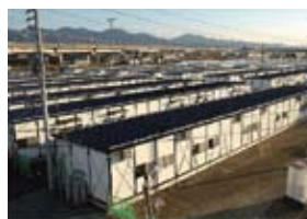
震災当時(千歳地区全景)