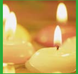
追悼と感謝の式典 ※写真はイメージです。