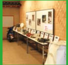
震災アーカイブ展