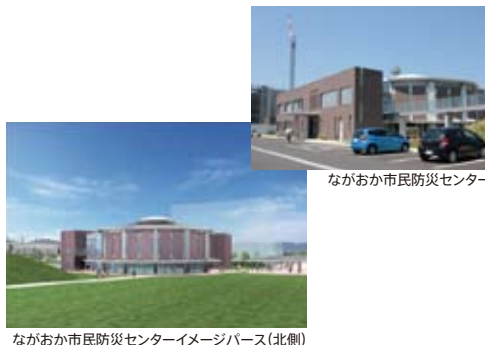
ながおか市民防災センター